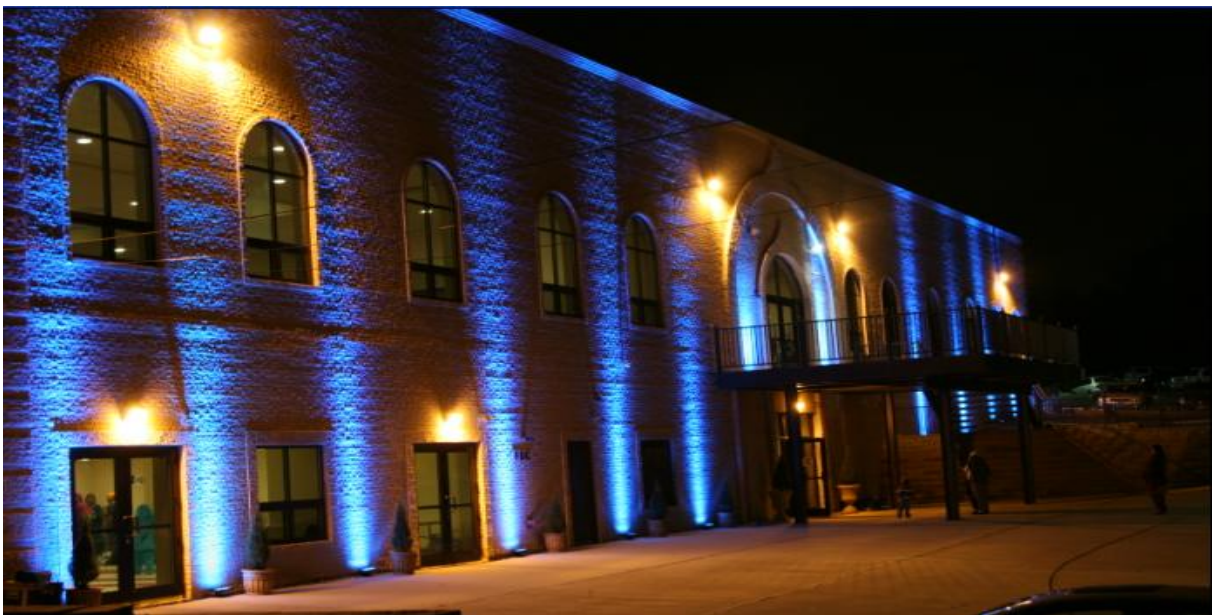
Special Decoration by Sangat members on Vaisakhi