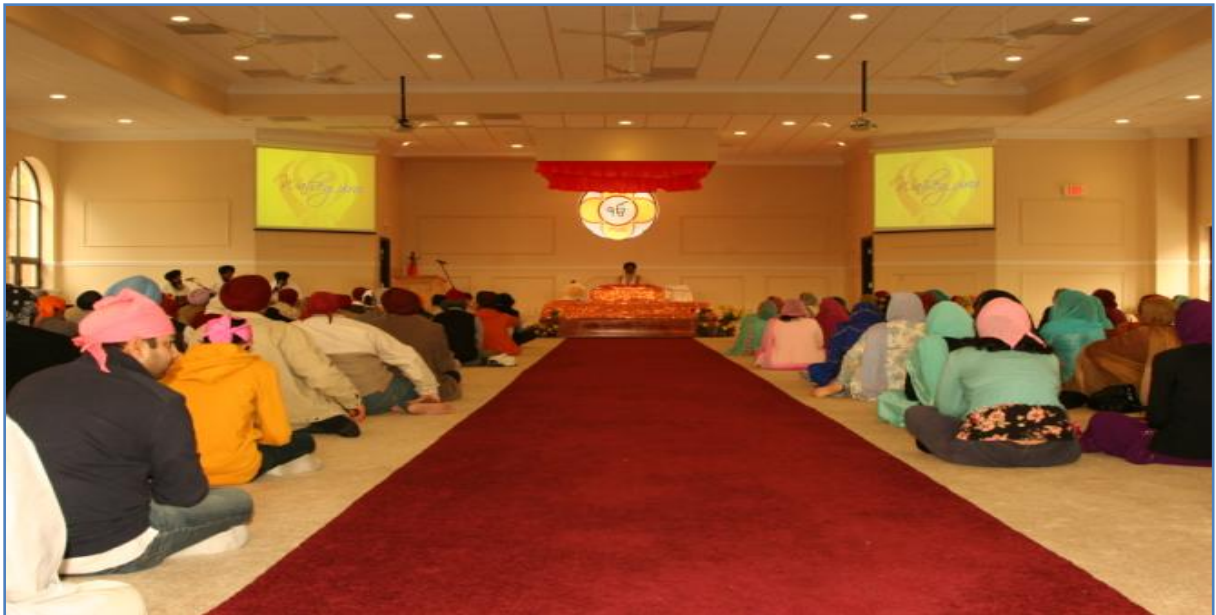
Our Darbar Hall

ਅਸੀਂ ਇਹ ਦੱਸਣਾ ਚਾਹੁੰਦੇ ਹਾਂ ਕਿ ਸਾਲ ੨੦੧੧ ਕਾਫੀ ਮੁਸ਼ਕਿਲ ਭਰਪੂਰ ਸੀ ਕਿਉਂ ਕਿ ਲਗ-ਭਗ ੧੦ ਸਾਲ ਤੋਂ ਇੱਥੇ ਕਿਸੇ ਕਮੇਟੀ ਦੀ ਕੋਈ ਚੋਣ ਨਹੀਂ ਸੀ ਹੋਈ । ਸੰਗਤ ਦਾ ਵਿਸ਼ਵਾਸ ਬਹਾਲ ਕਰਨਾ ਇੱਕ ਬਹੁਤ ਵੱਡੀ ਚੁਨੌਤੀ ਸੀ । ਸਾਡੇ ਸਾਹਮਣੇ ਦੋ ਚੋਣਾਂ ਸਨ {੧} ਕੀਹ ਅਸੀਂ ਭਵਿੱਖ ਦੀ ਉੱਨਤੀ ਨੂੰ ਅੱਖੋਂ ਪਰੋਖੇ ਕਰਕੇ ਕੇਵਲ ਬੀਤੇ ਵੱਲ ਹੀ ਵੇਖਦੇ ਰਹੀਏ {੨} ਜਾਂ GSSA ਦੇ ਸੁਨਹਿਰੀ ਭਵਿੱਖ ਨੂੰ ਉੱਜਲਾ ਬਣਾਉਣ ਲਈ ਮਿਲ ਕੇ ਅੱਗੇ ਵਧੀਏ ? ਅਸੀਂ ਨੰਬਰ ੨ ਦੀ ਚੋਣ ਕੀਤੀ ਅਤੇ ਸਾਰਿਆਂ ਨਾਲ ਮਿਲ ਕੇ ਇਹ ਸਕਾਰਾਤਮਕ ਕਦਮ ਅੱਗੇ ਵਧਾਏ !